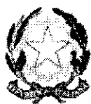
Prefettura – U.T.G. di Matera

tra Prefettura di Matera e le Stazioni Appaltanti: Provincia di Matera, Comune di Matera, Comune di Policoro, Comune di Pisticci, Comune di Bernalda, Comune di Montescaglioso, Comune di Scanzano Jonico, Comune di Tricarico, Comune di Irsina, Comune di Rotondella, Comune di Colobraro, Azienda Sanitaria Locale Matera – ASM, Azienda Territoriale Edilizia Residenziale Matera – ATER ai fini della prevenzione dei tentativi di infiltrazione mafiosa e dei fenomeni corruttivi nell’ambito degli appalti