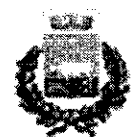
Comune di Bernalda